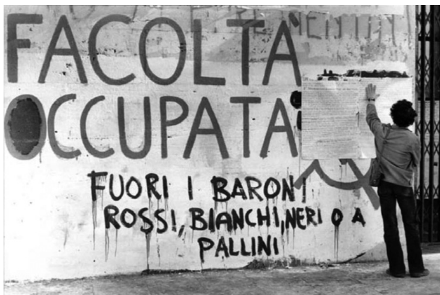
Dall'alto: Facoltà di Lettere, Università La Sapienza, Roma, 1977.