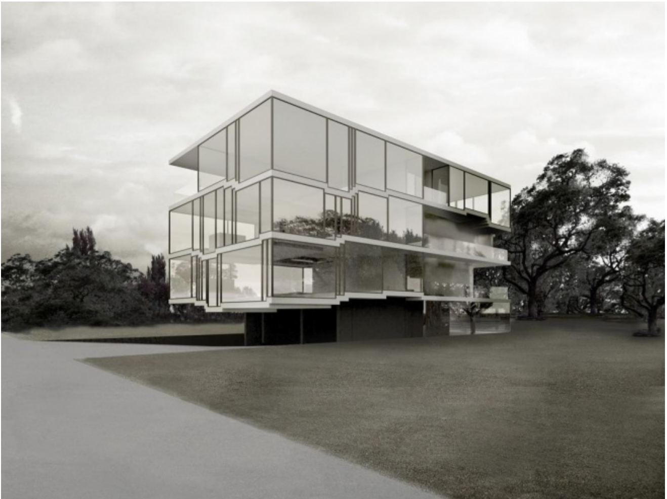
Philippe Rahm, Connective Apartments , 2014

Uscita dal Padiglione mi scappava un po' da ridere a pensare che già così funzionavano gli allevamenti di galline in batteria: prima un giorno da 24 ore con un grande sole artificiale a garanzia fisiologica dell'animale, poi 2 giorni da 12 ore, poi 3 giorni da 8 ore e la produzione viene triplicata... fino al tentativo di 4 giorni da 6, quando la natura si ribella, il guscio non calcifica e bisogna inventarsi le uova in lattina per restar sul mercato. In quegli anni in giro per il mondo fiorivano nei centri commerciali post-lasvegas, luoghi con le medesime artificialità, sebbene con opposte ambizioni, rispetto alla ricerca di Rahm. Lo Ski Dome nella baia di Tokyo che faceva sciare i salary men nipponici nelle ore del dopolavoro, con un sole artificiale (ops!) che accelerava il suo corso comprimendo il tempo in fasce orarie organizzate per turni di entrata (fino a 4 giorni artificiali in 1 giorno naturale). Nella finta montagna si trovava un finto chalet alpino (finto per il termine "alpino" non per la perfetta copia architettonica dello chalet) che non può che chiamarsi Belvedere perché le allegorie sono strumenti indispensabili per trasformare tristi scenografie in sogni sensorialisti (la sensorialità è un'altra cosa).